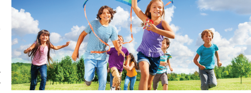
ପାଇଁ ଭଲ । ରୋଗ ପ୍ରତିରୋଧକ ଶକ୍ତି ବଜାୟଥାଏ ଏବଂ ସବୁ ପାନାୟ ଯେତେ ଅଣ୍ଡା ରଖେ । • ସଂସ୍ତାରେ ଥରେ କିମ୍ବା ଦୁଇଥର ସକ ପଖାଳ ମଧ୍ୟ ଖାଇବାକୁ ଦିଅନ୍ତୁ । ଆଇସକ୍ରିମ୍ ପରିବର୍ତ୍ତେ ପଇତ ପାଣି ପିଇବାକୁ ବେଳ ସହାର ଗୁଣ୍ଡବତା ପିଲାଙ୍କୁ କହିବାକୁ ଯେମିତି ନ ଲୁଲିଯାନ୍ତି ।

ମା' ମାନେ ଏବେଠାରୁ ସତର୍କ ହୋଇଯାଆନ୍ତୁ । ବ୍ୟାଗ୍ରେ ପାଣି ବୋତଲ ଦେବାକୁ ମୋଟେ ଲୁଲୁକୁ ନାହିଁ । ବିପିନ୍ ଡବାରେ ଏଣୁତେଣୁ ଚିପ, କେକ ବଦଳରେ ତରଳକୁଳୁ କାଟି କିମ୍ବା ଅଳୁର ଆଦି ଫଳ ଦେବା ଭଲ । • ପିଲା ଘରକୁ ଫେରିବା ପରେ ସେମାନଙ୍କୁ ଅଣ୍ଡା ମୁଦୁପାନାୟ କିମ୍ବା ଫୁଲ ପାଣି ଦିଅନ୍ତୁ ନାହିଁ । ବରଂ ପିଲାଙ୍କୁ ଲେୟୁ ପାଣି, ତରଳୁକ ରସ କିମ୍ବା ଦହି ସର୍ବତ୍ର ଦେଇପାରିବେ । ଲେୟୁ ପାଣିରେ ଯୋଡ଼ିବା ପତ୍ର ଛୋଟ ମିଶାଇ ଦିଅନ୍ତୁ । ସ୍ଵାଦ ଭଲ ଲାଗିବା ସହ ଏସବୁ ଶରୀର