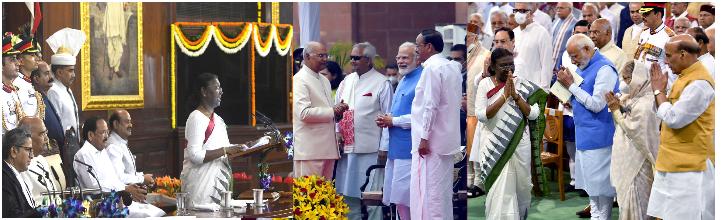
ନବନିର୍ବାଚିତ ରାଷ୍ଟ୍ରପତି ଡ୍ରୋପଦୀ ମୁର୍ମୁଙ୍କ ଶପଥ ଗ୍ରହଣ ସମାରୋହ

ଦାୟିତ୍ୱ ଗ୍ରହଣ କରିବା ମୋ ପାଇଁ ଗୁରୁତ୍ୱପୂର୍ଣ୍ଣ। କୁଳାଳ ୨୬ ତାରିଖ ହେଉଛି 'କାର୍ଗିଲ ବିଜୟ ଦିବସ'। ଏହି ଦିବସ ଭାରତୀୟ ସେନାର ଶୌର୍ଯ୍ୟ ଓ ଧୈର୍ଯ୍ୟର ପ୍ରତିଫଳନ କରୁଛି। 'କାର୍ଗିଲ ବିଜୟ ଦିବସ' ଉପଲକ୍ଷେ ଦେଶର ସମସ୍ତ ବାହିନୀ ଓ ଦେଶର ନାଗରିକମାନଙ୍କୁ ମୋର ଆଗୁଆ ଅଭିନନ୍ଦନ। ମୁଁ ଆଦିବାସୀ ସମ୍ପ୍ରଦାୟ ହୋଇ ମଧ୍ୟ ଜଣେ ଧୂର୍ତ୍ତ କାଉନ୍ସିଲର ଭାବରେ ରାଷ୍ଟ୍ରପତି ହେବାର ସୁଯୋଗ ପାଇଛି। ଏହା ହେଉଛି ଗଣତନ୍ତ୍ର ଜନତା ଭାରତର ମହାନତା। ମୁଁ ସମସ୍ତ ଦେଶବାସୀ, ବିଶେଷକରି ଭାରତର ଯୁବବର୍ଗ ଏବଂ ମହିଳାମାନଙ୍କୁ ନିଜର ପ୍ରତିଶ୍ରୁତି ଦେଉଛି ଯେ, ଏହି ପଦବୀରେ ରହି ଆଗାମୀ ୨୫ ବର୍ଷର ପରିକଳ୍ପନା ସମାପନ କରିବାକୁ ପ୍ରସ୍ତୁତ କରୁଥିବା ଏଭଳି ସ୍ୱରଣାୟ ସମୟରେ ନୂତନ