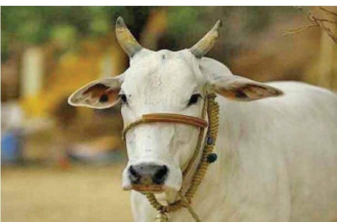
ହାତ ନ ଧୋଇ ବିଭିନ୍ନ ଗାଈ ଦୁହିଁଙ୍କେ ଏହି ରୋଗ ବ୍ୟାପୁଥିବା ପ୍ରାଣୀ ଚିକିତ୍ସକଙ୍କ ମତ । ତେଣୁ ଗାଈ ଖୁବ୍ ଖାଉଥିଲେ ସ୍ତରକୁ ଭଲ ଭାବରେ ଗରମ କରି ଖାଇବା ପାଇଁ ପରାମର୍ଶ ଦେଇଛନ୍ତି ବିଶେଷଜ୍ଞ । ଲମ୍ପି ଭିନ୍ନ ରୋଗର ଲକ୍ଷଣ କଣ ?

ମଇଁଷି ପରିବହନ ଉପରେ ମଧ୍ୟ କଡ଼ା କଡ଼ାକଡ଼ା ଲଗାଇଛି ରାଜ୍ୟ ସରକାରଙ୍କ ମଧ୍ୟ ଓ ପଶୁ ସମ୍ପଦ ବିଭାଗ । ଲମ୍ପି ଭାଇରସ୍ ନିୟନ୍ତ୍ରଣକୁ ଆଣିବାକୁ ଏବେ ରାଜ୍ୟର ସାମାଜିକ ଜିଲ୍ଲାକୁ ଧ୍ୟାନରେ ରଖିଛନ୍ତି ରାଜ୍ୟ ସରକାର । ମୁଖ୍ୟତଃ ସାମାଜିକ ଜିଲ୍ଲା, ବୃକ୍ଷ ଓ ଗାଁ ଗୁଡ଼ିକରେ ବ୍ୟାପକ ସଚେତନତା ସହ ୫ କିମି ପରିଧି ଉପରେ ନକର ରଖିବାକୁ ନିର୍ଦ୍ଦେଶ ଦିଆଯାଇଛି । ଗୋ-ମଇଁଷି ପରିବହନ ଉପରେ କଡ଼କଡ଼ା ଲଗାଯିବା ସହ ଖିସ୍ତା ମହକୁମା ରଖିବାକୁ ନିର୍ଦ୍ଦେଶ ଦିଆଯାଇଛି । ମଣ୍ଡା ଓ ଚିକ୍ ଦ୍ୱାରା ଏହି ରୋଗ ଗୋଟିଏ ପଶୁଠାରୁ ଅନ୍ୟକୁ ବ୍ୟାପିଥାଏ । ରୋଗରେ ଆକ୍ରାନ୍ତ ଗାଈଗୋରୁ ଅନ୍ୟମାନଙ୍କ ସଂସ୍ପର୍ଶରେ ଆସିଲେ ମଧ୍ୟ ଏହା ବ୍ୟାପିଥାଏ । ଗାଁ ଗହଳରେ ଗାଈ ଦୁହିଁଙ୍କୁ ଆସୁଥିବା ଲୋକେ