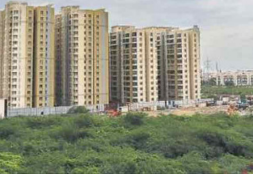
ବିଭାଗ ପକ୍ଷରୁ ସେପ୍ଟେମ୍ବର ୧୨ ତାରିଖରେ ସଂଶୋଧିତ ନିୟମାବଳୀ-୨୦୨୨ ରେକର୍ଡେଡ୍ ବିକ୍ରମ ପ୍ରକଳ୍ପ ହୋଇଛି । ଓଡ଼ିଶା ରିଏଲ୍ ଇଷ୍ଟେଟ୍ (ନିୟମାବଳୀ ଏବଂ ବିକାଶ) ସଂଶୋଧିତ ନିୟମ-୨୦୨୨ରେ

ଭୁବନେଶ୍ୱର : ଅଗଷ୍ଟ ୫ ତାରିଖରେ ହାଇକୋର୍ଟଙ୍କ ହସ୍ତକ୍ଷେପ ପରେ ରାଜ୍ୟରେ ଆପାର୍ଟମେଣ୍ଟ ଖରିଦ-ବିକ୍ରରେ ଘୋର ଲାଗିଯାଇଥିଲା । ରାଜ୍ୟ ସରକାର ଏବେ ରେଭା ନିୟମାବଳୀ-୨୦୧୭ରେ ସଂଶୋଧନ ଆଣି ବିକ୍ଷୁବ୍ଧ ପ୍ରକଳ୍ପ କରିଥିବାରୁ ପୁଣି ଥରେ ଫୁଟ୍ କିଣାବିକା ହୋଇପାରିବ । ତେବେ ପ୍ରମାଣପତ୍ରମାନେ ଓରେଭା (ଓଡ଼ିଶା ରିଏଲ୍ ଇଷ୍ଟେଟ୍ ଅଥରିଟି)ଙ୍କ ନିୟମ ପୂରଣ ନ କରି ଫୁଟ୍ ବା ଆପାର୍ଟମେଣ୍ଟ କିଣା-ବିକା କରିପାରିବେ ନାହିଁ । ରାଜ୍ୟ ଗୃହ ନିର୍ମାଣ ଓ ନଗର ଉନ୍ନତ ବିଭାଗ ପକ୍ଷରୁ ରେଭା ନିୟମାବଳୀ-୨୦୧୭କୁ ଅଧିକ ସୁସଂଗତ କରାଯାଇଛି । ଏ ନେଇ