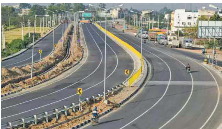
କରିବାକୁ କୁହାଯାଇଛି । ଏଭଳି ଯୋଜନାକୁ ସଫଳ ସୁରକ୍ଷା ନିର୍ମାଣ କରିଥିବା ବେଳେ ରାଷ୍ଟ୍ରକର୍ତ୍ତୃରେ ଜବରଦଖଲ ଉଦ୍ଦେଶ୍ୟ ବଡ଼ ତାଲେଖି ହେବ ବୋଲି ମତ ରଖିଛନ୍ତି । ତେବେ ଏନେଇ

ଭୁବନେଶ୍ୱର: ଜାତୀୟ ରାଜପଥ ଓ ରାଜ୍ୟ ରାଜପଥରେ ରହିବ ସ୍ୱତନ୍ତ୍ର ଟ୍ରାକ୍ । ଯେଉଁଥିରେ କେବଳ ପଥଚାରୀ ଚାଲିବେ । ଠିକ୍ ସେମିତି ସାଇକେଲ ଚାଳକଙ୍କ ପାଇଁ ମଧ୍ୟ ରହିବ ସ୍ୱତନ୍ତ୍ର ଟ୍ରାକ୍ । କିନ୍ତୁ ସେହି ରାଷ୍ଟ୍ରରେ ଯାନବାହନ ଯାଇପାରିବ ନାହିଁ । ରାଜ୍ୟର ସବୁ ସଡ଼କରେ ଏଭଳି ଡିଜାଇନ୍ ରହିବ । ଦୁର୍ଘଟଣା ରୋକିବା ଲାଗି ପରିବହନ ବିଭାଗ ରାଜ୍ୟ ମୋଟର ଭେଇକିଲ୍ ଆକ୍ଟ ୧୯୯୩ରେ ସଂଶୋଧନ କରି ଏହି ନିୟମ ଲାଗୁ କରିବାକୁ ଯାଉଛନ୍ତି । ସେଥିପାଇଁ ବିଭାଗ ପ୍ରସ୍ତୁତ କରିଛି ଡ୍ରାଫ୍ଟ ପଲିସି । ଜାତୀୟ ରାଜପଥ ଓ ରାଜ୍ୟ ରାଜପଥରେ ପଥଚାରୀ ଓ ସାଇକେଲ ଚାଳକ ଯାଉଥିବାରୁ ଅଧିକାଂଶ ସମୟରେ ଭିଡ୍ ହେଉଛି । ତା’ଛଡ଼ା ଯାନବାହାନର ଦ୍ରୁତ ଗତି ଯୋଗୁଁ ପଥଚାରୀ