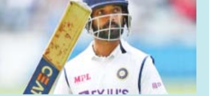
ବର୍ତ୍ତମାନ-ଗାଭାସ୍କର ଟେଷ୍ଟ ସିରିଜରେ ରୋହିତ ଶର୍ମାଙ୍କ ନେତୃତ୍ୱାଧୀନ ଦଳ ଅଷ୍ଟ୍ରେଲିଆକୁ ୨-୧ରେ ହରାଇଥିଲା। ଅଷ୍ଟ୍ରେଲିଆ ଏଥର ପ୍ରଥମ ଥର ପାଇଁ ବିଶ୍ୱ ଟେଷ୍ଟ ଚାମ୍ପିୟନଶିପ ଫାଇନାଲକୁ ଯାଇଥିବା ବେଳେ ଭାରତ ଦ୍ୱିତୀୟ ଥର ପାଇଁ ଯାଇଛି। ଅଷ୍ଟ୍ରେଲିଆ ମଧ୍ୟ ବିଶ୍ୱ ଟେଷ୍ଟ ଚାମ୍ପିୟନଶିପ ଫାଇନାଲ ପାଇଁ ଦଳ ଘୋଷଣା କରିସାରିଛି। ପ୍ୟାଟ୍ କମିନ୍ସଙ୍କ ନେତୃତ୍ୱରେ ସ୍କଟ୍ ବୋଲାସ, ଆଲେକ୍ସ କ୍ୟାମାରା, କ୍ୟାମରୁନ ଗ୍ରାନ, ମାରକସ ହ୍ୟାରିସ, ଜୋଶ ହାଜେଲଉଡ, ଟ୍ରାଭିସ ହେଡ୍, ଜୋଶ ଇଜାର୍ଡ, ଉସମାନ ଖୁଜା, ମାର୍କସ୍ ଲାଲୁଶେନ, ନାଥନ ଲାୟନ, ମିଚେଲ ମାର୍ଶ, ଗୋଟ ମର୍ସି, ମାଥ୍ୟୁ ରେନେସ, ସ୍କଟ୍ ସ୍ଟିଭ (ଉପ-ଅଧିନାୟକ), ମିଚେଲ ସ୍ଟାର୍କ ଓ ତାରିତ୍ ଭୂର୍ଷନର ଦଳରେ ସାମିଲ ହୋଇଛନ୍ତି।

କାଚୁଡ଼ା, ଅକ୍ଷୟ ପଟେଲ, ଶାର୍ଦୂଲ ଠାକୁର, ମହମ୍ମଦ ଶାମି, ମହମ୍ମଦ ସିରାଜ୍, ଉମେଶ ଯାଦବ ଓ ଜୟଦେବ ଉନାଦକଟ୍ ଟିମରେ ସାମିଲ ହୋଇଛନ୍ତି। ବିଶ୍ୱ ଟେଷ୍ଟ ଚାମ୍ପିୟନଶିପ ଫାଇନାଲରେ ଭାରତର ପ୍ରତୀକ୍ଷା ଅଷ୍ଟ୍ରେଲିଆ ସହିତ ହେବ। ଲଣ୍ଡନର ଓଭାଲରେ ଜୁନ ୭ ତାରିଖରୁ ଜୁନ ୧୧ ତାରିଖ ପର୍ଯ୍ୟନ୍ତ ଏହି ମ୍ୟାଚ ଖେଳାଯିବ। ନିକଟରେ ଭାରତରେ ଖେଳାଯାଇଥିବା ୪ଟି ମ୍ୟାଚ ବିଶିଷ୍ଟ