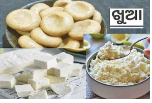
ଅପରପକ୍ଷରେ ସବୁରୁ ଅଧିକ ଖୁଆ ଦର ଲାଗୁ ହେବା ପରେ ଖୁଆ କେଜି ୩୧୦ ଟଙ୍କା ବୃଦ୍ଧି କରାଯାଇଛି। ବର୍ତ୍ତମାନ ଖୁଆ କେଜି ଦର ୨୬୦ ଟଙ୍କା ରହିଥିବାବେଳେ ବଢ଼ିଥିବା

ଭୁବନେଶ୍ୱର: କ୍ଷୀରଦର ବଢ଼ିଥିବାରୁ ଦୁଗ୍ଧଜାତ ଦ୍ରବ୍ୟର ବୃଦ୍ଧି ପାଇଛି। ମେ' ୧ରୁ ବଢ଼ିବ ଦୁଗ୍ଧଜାତ ଦ୍ରବ୍ୟର ଦର ବୃଦ୍ଧି ପାଇବ। ଏ ନେଇ କଟକ ଜିଲ୍ଲା ଦୁଗ୍ଧଜାତ ଦ୍ରବ୍ୟ ବ୍ୟବସାୟୀ ସଂଘ ନିଷ୍ପତ୍ତି ନେଇଥିବା ସୂଚନା ଦିଆଯାଇଛି। ସଂଘର ନିଷ୍ପତ୍ତି ଅନୁସାରେ ଛେନା କେଜି ୨୦ ଟଙ୍କା ବଢ଼ିଛି। ବର୍ତ୍ତମାନ ଛେନା କେଜି ପ୍ରତି ୧୭୫ ଟଙ୍କା ରହିଥିବାବେଳେ ବଢ଼ିବା ପରେ ଏହା ୧୯୫ ଟଙ୍କା ହେବ। ସେହିପରି ପନିର କେଜି ୩୦ ଟଙ୍କା ବଢ଼ିଛି। ବର୍ତ୍ତମାନ ପନିର କେଜି ୨୨୫ ଟଙ୍କା ରହିଥିବାବେଳେ ବଢ଼ିତ ଦର ଲାଗୁ ହେବା ପରେ ଏହା ୨୫୫ ଟଙ୍କାରେ ପହଞ୍ଚିବ।