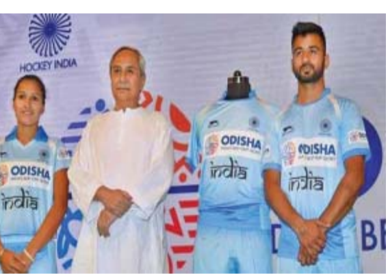
ମସିହାରେ ଓଡ଼ିଶା ଉଭୟ ଜାତୀୟ ପ୍ରାୟୋଜକ ରହିଛି। ୦୨୩ ପୂରୁଷ ଓ ମହିଳା ହକି ଟିମର ମସିହାରେ ଏହି ପ୍ରାୟୋଜକ ଅରବ୍ଧ

ରାଜ୍ୟ ସରକାରଙ୍କ ପକ୍ଷରୁ ମିଳିଥିବା ସୂଚନା ଅନୁସାରେ ମୋଟ ୧୫ଟି ପ୍ରସ୍ତାବକୁ ଅନୁମୋଦନ ମିଳିଛି। ଏହି ବୈଠକରେ ଭାରତୀୟ ହକି ଦଳର ଆଉ ୧୦ ବର୍ଷ ପ୍ରାୟୋଜକ ହେବ ଓଡ଼ିଶା ଏବଂ ୨୦୨୩ ପର୍ଯ୍ୟନ୍ତ ପ୍ରାୟୋଜକ ହେବାକୁ ରାଜ୍ୟ କ୍ୟାବିନେଟରେ ନିଷ୍ପତ୍ତି ନିଆଯାଇଛି। ଓଡ଼ିଶାରେ ଦୁଇ ଥର ବିଶ୍ୱକପ୍ ହକି ପ୍ରସ୍ତାବ ପ୍ରତିଯୋଗିତା ଆୟୋଜନ କରିଥିବା ଓଡ଼ିଶା ଖଣି ନିଗମ ୨୦୩୩ ପର୍ଯ୍ୟନ୍ତ ଭାରତୀୟ ଜାତୀୟ ହକି ଟିମକୁ ଟିମର ପ୍ରାୟୋଜକ ରହିବେ। ୨୦୧୮